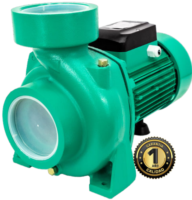
FLUJO DE SUBIDA