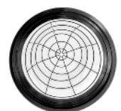
BOLSA DE FILTRO