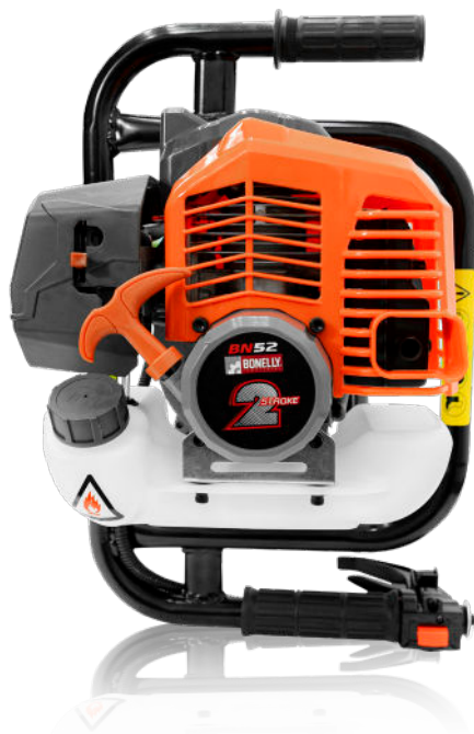
MOTOR 2T IE44F